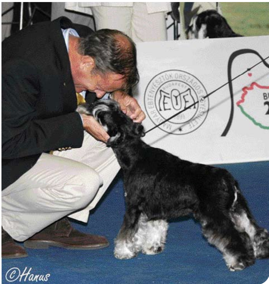
• Een knuffel voor een Schnauzer op de Europese Show in Boedapest 2008.