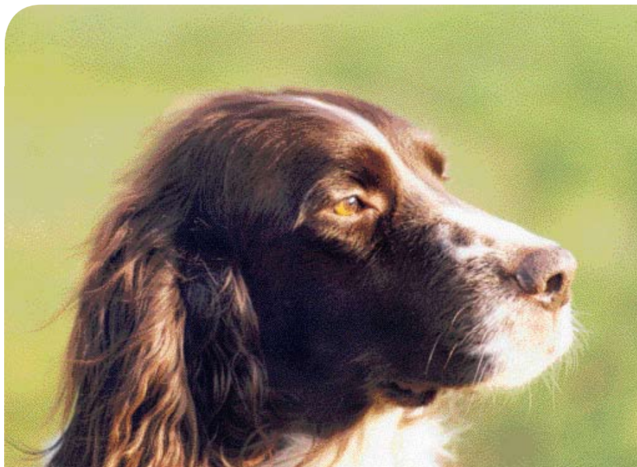
♦ Met de Épagneul Français teef 'Babettes des Sans Culottes' heeft Wim Wellens geëxposeerd, gewerkt en in beperkte mate gefokt.