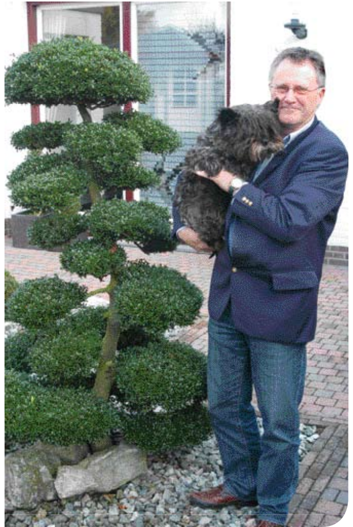
♦ Cairn Terrier 'Fin' is nu de enige viervoeter in huize Wellens.

'Picture Perfect – zonder overdrijving' heet, de rassen die 'aandacht', 'verhoogde aandacht' en 'dringende aandacht' verdienen als ze door keurmeesters worden gekeurd. Het gaat daarbij onder andere over uitpuilende of diepliggende ogen, teveel huidplooiën, ademhalingsproblemen door de vorm van de kop, extreme gewichten, enzovoort. De publicatie van dit document is gebeurd in samenwerking met de Vereniging van Kynologisch Keurmeesters (VKK).