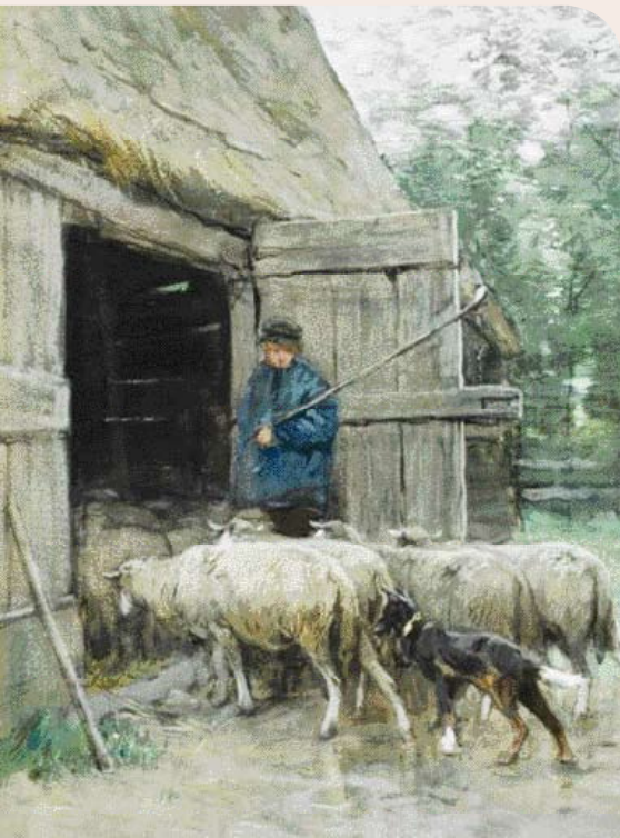
• 'De terugkomst' van Anton Mauve.

Nergens wordt gesproken over scherpste, vechtlust of hardheid. Dat zou hem ongeschikt maken als reddingshond, speurhond en bij behendigheid. Ook bij het schapen hoeden mag de hond slechts bij hoge uitzondering een schaap vastpakken, maar niet doorbijten!