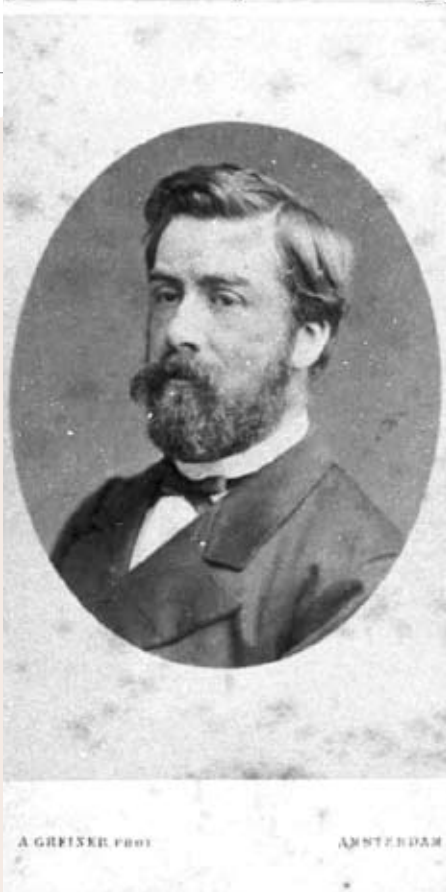
• Anton Mauve. (Foto: A. Greiner)

waar alert, maar maakt niet de indruk tussen de herderin en de schapen te willen springen om hen tot spoed te manen. In feite staan ze er allemaal een beetje afwachting bij.