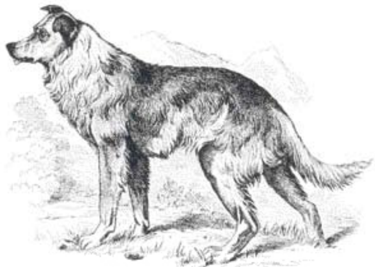
• 'Inlandse Herdershond', circa 1875. Naar: Nimrods 'Beschrijving van honden en keurboek volgens punten vastgelegd'.