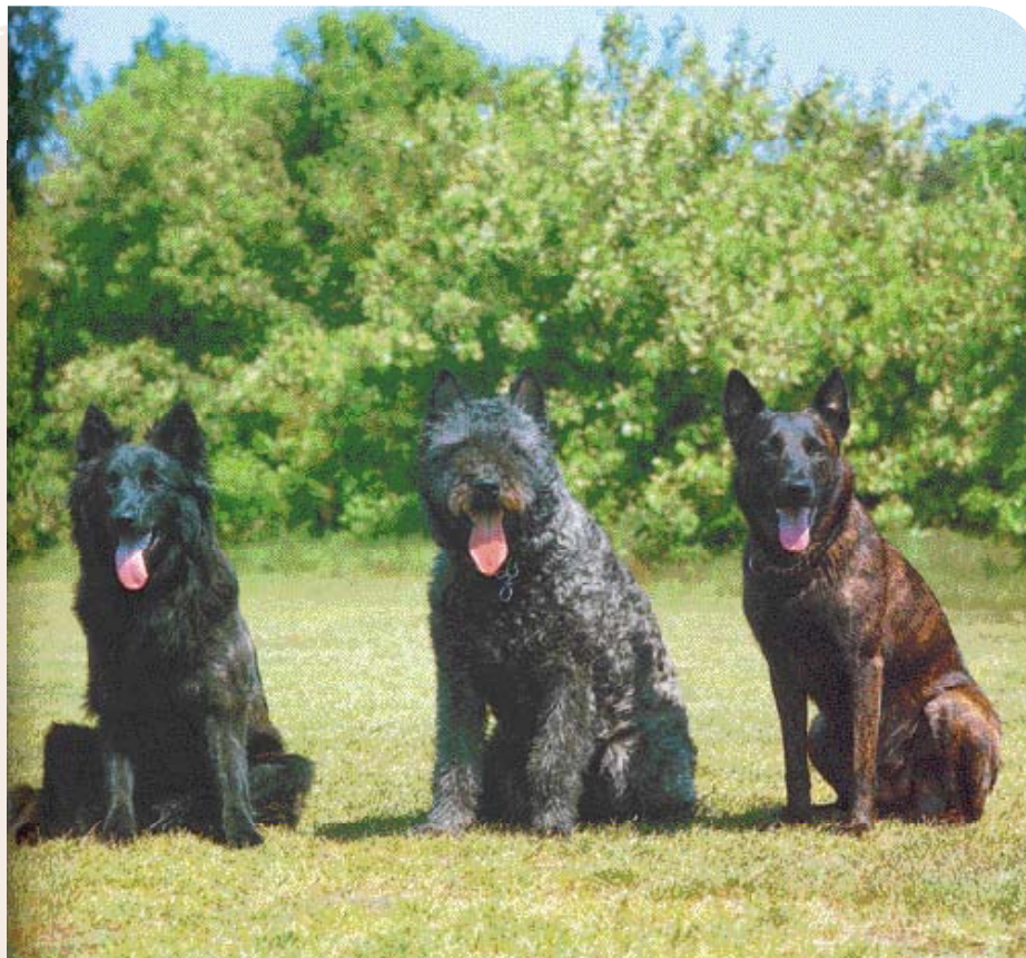
♦ De drie variëteiten Hollandse Herdershond: langhaar, ruwhaar en korthaar..

De raszuivere fokkerij staat in die periode nog in de kinderschoenen. Bruikbaarheid is het uitgangspunt en kleuren en haarvariëteiten spelen niet altijd mee bij de keuze van de ouderhonden. De belangstelling voor dit type hond neemt echter toe en op de 'Algemeene Tentoonstelling van Vee, Voortbrengselen van en Werktuigen voor de Landbouw', Amsterdam 1874, verschijnen niet alleen twee 'vreemde herdershonden', maar ook één 'inlandse herdershond'. Een rasbeschrijving is vastgelegd in Nimrods 'Beschrijving van honden en keurboek volgens punten vastgelegd' uit 1875. We lezen daarin dat de inlandse herdershond een hond 'van middelmatige grootte' is, 'slank maar stevig gebouwd, liefst wat hoog op de poten'. De beharing is dicht en stug, zodat hij tegen de Hollandse weersgesteldheid