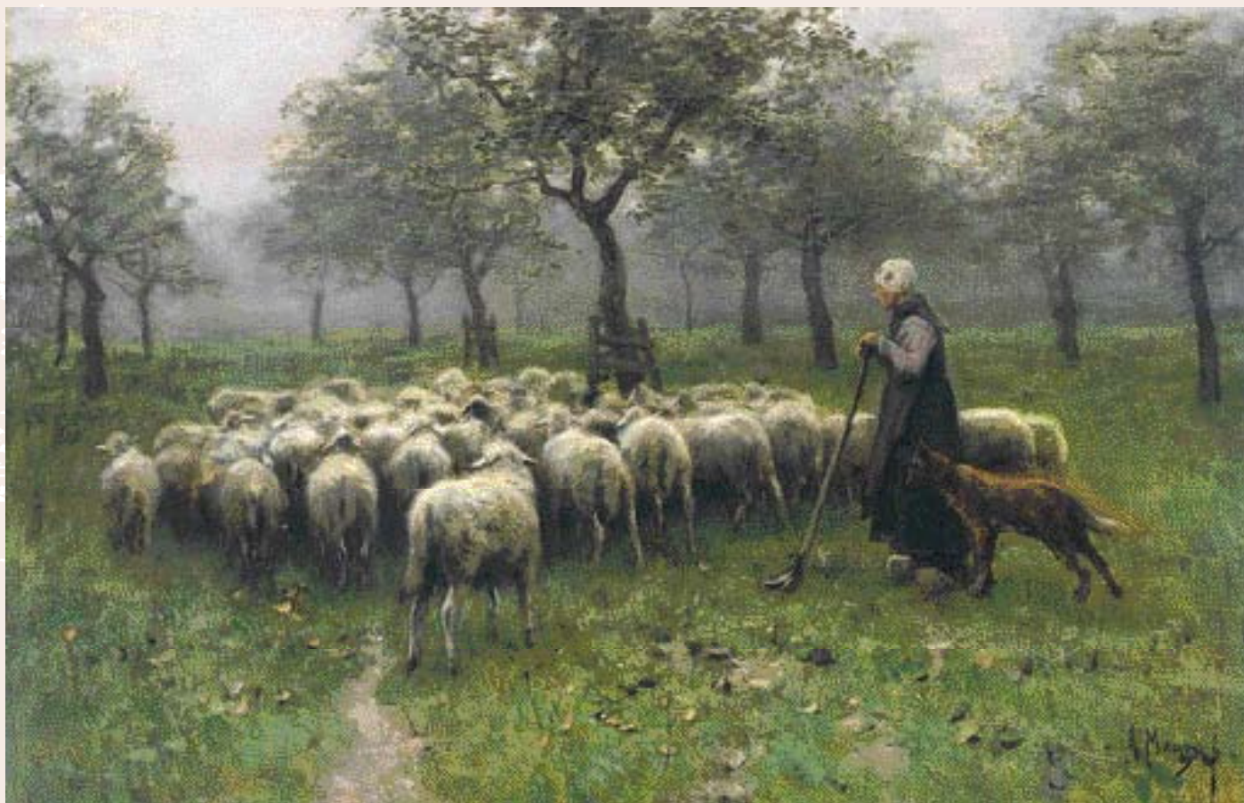
• 'Herderin met kudde schapen in een boomgaard' van Anton Mauve (1838-1888).

Ze spelen, rennen achter wild aan, verzorgen pups of kijken ons alleen maar aan: honden op schilderijen. Schilderstukken die onmisbaar zijn bij het ontrafelen van de geschiedenis van rashonden...