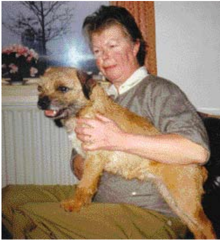
• Met Border Terrier Kamp. Villathorn Tiger's Eye at Brumberhill, circa 1997.