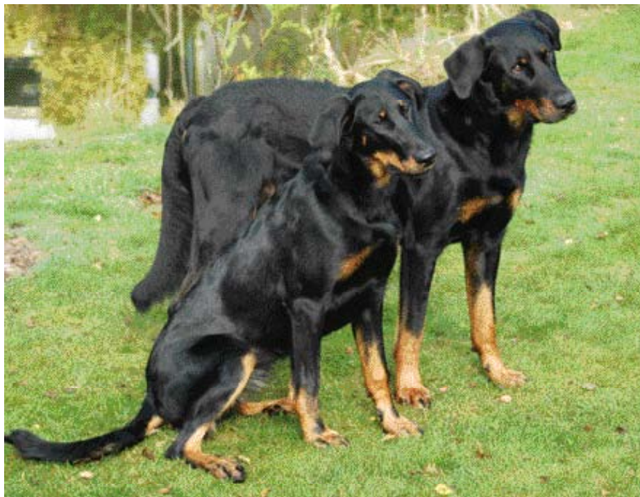
• De Franse Herdershond Beauceron is in eerste instantie een werkhond met als taak het hoeden van schapen.

de morgen en vertrokken pas in de avond, nadat de laatste hond de hallen verlaten had én ik mij geen seconde had verveeld.'