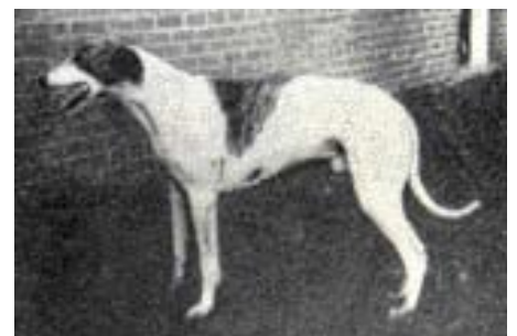
• Een 'Oud-Friesche Windhond' in Toepoels Hondencyclopedie van voor 1947.