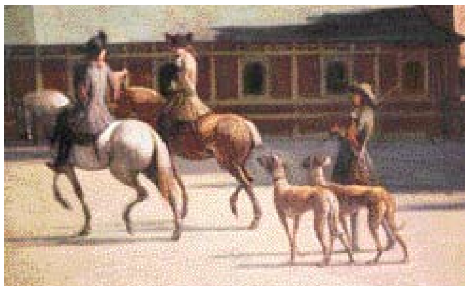
♦ Detail van een schilderij dat Gerrit Berckheyde in 1696 maakte van de Grote Markt in Haarlem met daarop twee windhonden.