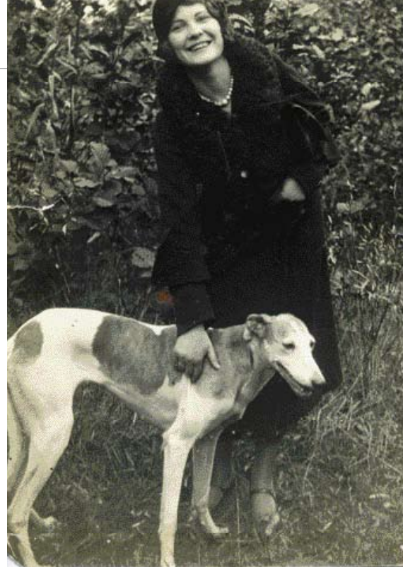
♦ Een goede, stamzuivere Friese Windhond teef. De blauwgrijs gestroomde platen zijn van een kleurslag dat destijds werd aangeduid met snoekkleurig.