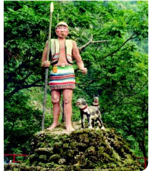
♦ Een houten beeld in Wulai, dat een lid van de Atayal stam voorstelt, vergezeld door zijn jachthonden. De vele stammen op Formosa staan bekend als jagers en krijgers, terwijl de vrouwen traditionele kleding weven.

Hokkaido, Shiba en Akita, allemaal Japanse rassen. Maar, ook de Australische Dingo en de Australian Cattle Dog, het ras met Dingo bloed, lijken op de Taiwan Dog. Er is een periode geweest waarin de Taiwan Dog zich half wild voortplant in de bergen en de bossen van Taiwan. Echter, als resultaat van de overheersing door diverse koloniale grootmachten, vindt er in de loop van de eeuwen vermenging met andere