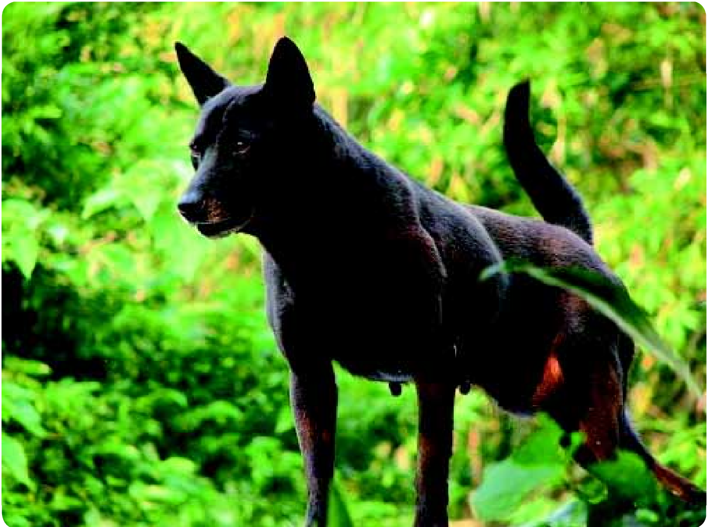
• De huidige gebruikswaarde van de Taiwan Dog is jachthond, waakhond en gezelschapshond..

tussen (de Volksrepubliek) China en Taiwan (de Republiek China) een beetje en vanaf die periode streeft men ook naar betere politieke en economische verhoudingen. Taiwan is ongeveer even groot als Nederland en telt ruim 23 miljoen inwoners, van wie ruim 90% Chinezen zijn, en de rest is verdeeld over meer dan 50 stammen. De officiële taal is nu Mandarijn, er is vrijheid van godsdienst en ongeveer een kwart van de bevolking is Boeddhist.