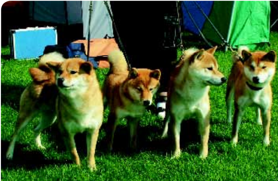
♦ De Shiba lijkt, net zoals een aantal andere Japanse rassen, op de Taiwan Dog.

Dog zou kunnen rangschikken. Het eerste teken dat er in het oude Formosa – tot 1945 de naam van Taiwan – honden bij de jacht zijn gebruikt, zie ik in Wulai, in het noorden van Taiwan. Het is een metershoog houten beeld van een jager uit de Atayal stam, behorend tot de aboriginals van Taiwan. Naast de jager staan twee honden.