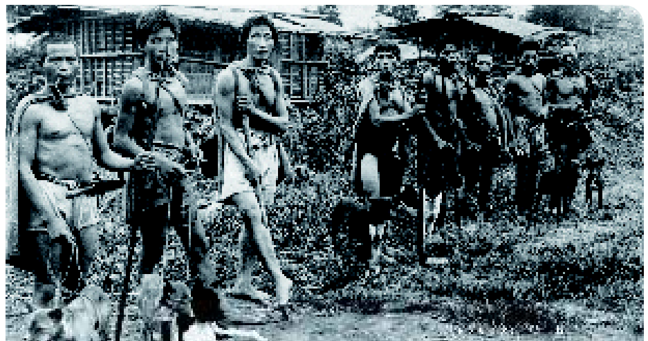
♦ Een werkelijk schitterende foto van Taiwanese aboriginals, klaar voor de jacht, met hun honden, die van een opvallend eenvormig type zijn. Aan de grootte en het uiterlijk van de jagers is goed te zien dat zij niet verwant zijn met de Chinezen.

typen plaats. Het is daarom halverwege de twintigste eeuw vrijwel onmogelijk om nog raszuivere exemplaren te vinden. Hierna wordt in dit artikel steeds gesproken over de Taiwan Dog, maar in de literatuur is Formosan (Mountain) Dog de meest gebruikte naam.