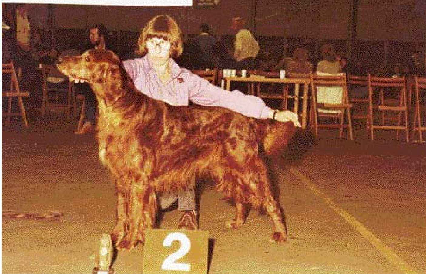
♦ Kampioenschapsclubmatch van de Ierse Setter Club, 1980. 'Van Huize Comtessa' is een succesvolle kennel in die jaren.