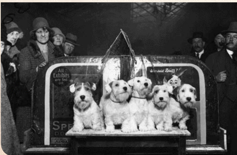
♦ Sealyham Terriers op Crufts, februari 1930.