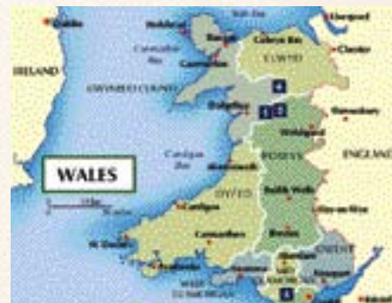
• Kaartje van Wales. 'Sealyham House' ligt ten noorden van Pembroke.