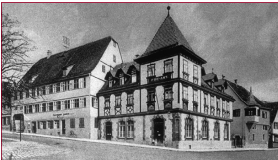
• Het geboortehuis van Heinrich Essig in Leonberg. Het linker gebouw, gelegen naast het postkantoor, aan de Grabenstrasse 4.

Er is slechts één echt portret van Essig bekend, waarop hij zittend is afgebeeld – compleet met 'Schnurrbart', horlogeketting, bolhoed en wandelstok – met aan zijn voeten een grote zwarte, langharige hond, die aan