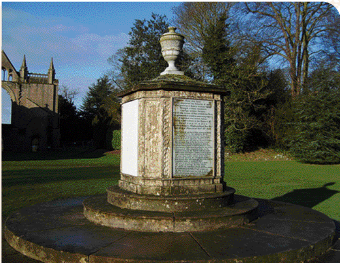
• De tombe die Lord Byron liet bouwen voor zijn hond 'Boatswain'.