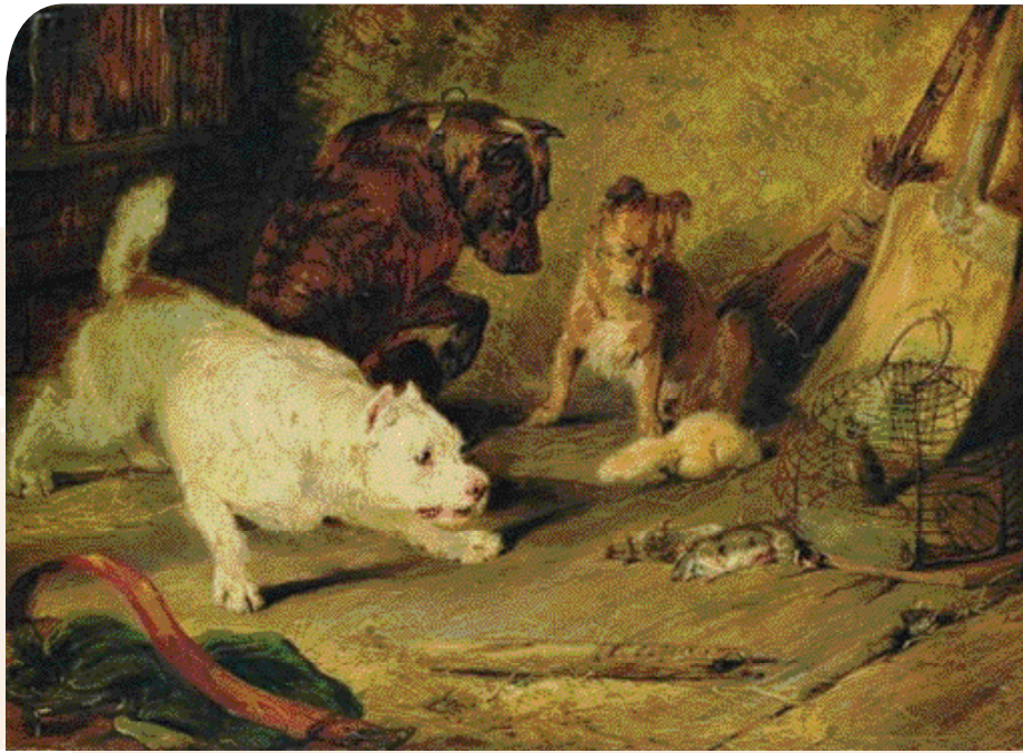
• 'Ratcatchers' (1821), de honden van Sir E. Landseer. De witte Terrier is 'Brutus', de Staffordshire Bull Terrier heet 'Boxer' en de kleine Terrier is 'Vixen'.

Landseer in 1834 en in veel van zijn schilderijen is zijn liefde voor dat land terug te vinden. Landseers ster stijgt snel; zo wordt hij gevraagd om de romans van Sir Walter Scott te illustreren en maakt hij de tekeningen voor Cassell's The Book of the Dog (1881) en Dalziel's British Dogs (1889).