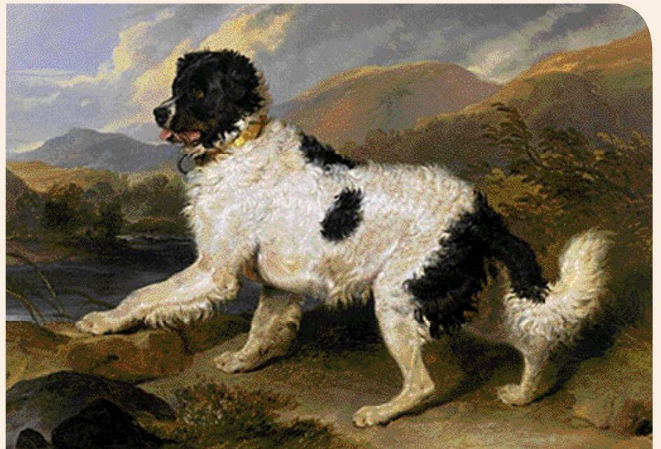
• 'Lion, A Newfoundland Dog', geschilderd door Landseer in 1824. (Victoria & Albert Museum, Londen)