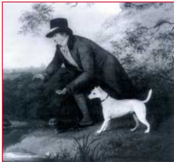
De titel van dit schilderstuk (detail) is "Sportsman with a White English Terrier and a Toy Dog", gemaakt door Henry Bernhard Chalon in 1804. Een vroege afbeelding van dit type Terrier. Lezers met goede ogen kunnen links de das zien, waarop zowel de sportsman als de beide honden zijn gefixeerd.